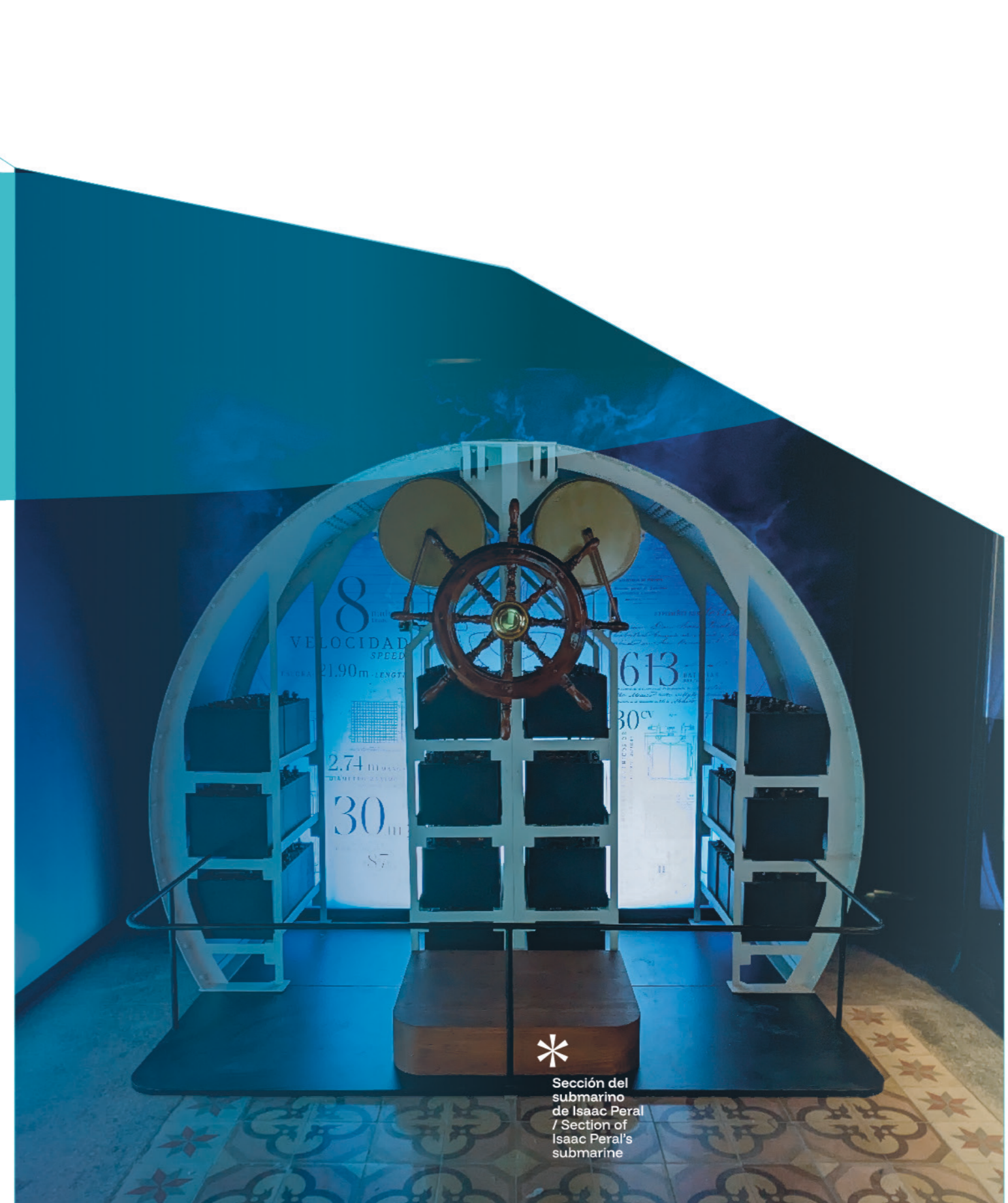
Sección del submarino de Isaac Peral / Section of Isaac Peral's submarine

The third floor of the house museum is dedicated to the social construction of the figure and to highlighting the fame he came to achieve. Through a large collection of objects linked to the inventor, such as publications and popular artefacts, which interpret and represent Isaac Peral over time, we will see the impact he had by the end of the 19th century and how he was subsequently largely forgotten.